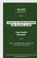
Carte de visite