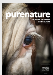
Dossiers de presse thématiques

Tout support de communication créé ou réutilisé hors opération mutualisée avec le CRT PACA (éditions, affichage, goodies, PLV, vidéos, réseaux sociaux, etc.) ainsi que tout support de communication interne à l'Agence de Développement (papier en-tête, carte de visite, supports de réunion, etc.)