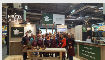
Salon de l'Agriculture