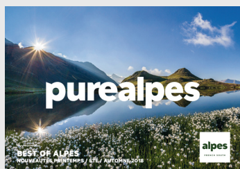
Dossier de presse